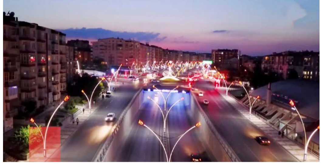
Kütüphane, Park, Sosyal tesisi veya Meydan, Bulvar, Caddeye isminin verilmesi talebinin görüşülerek karara bağlanması oylanarak karara bağlandı.