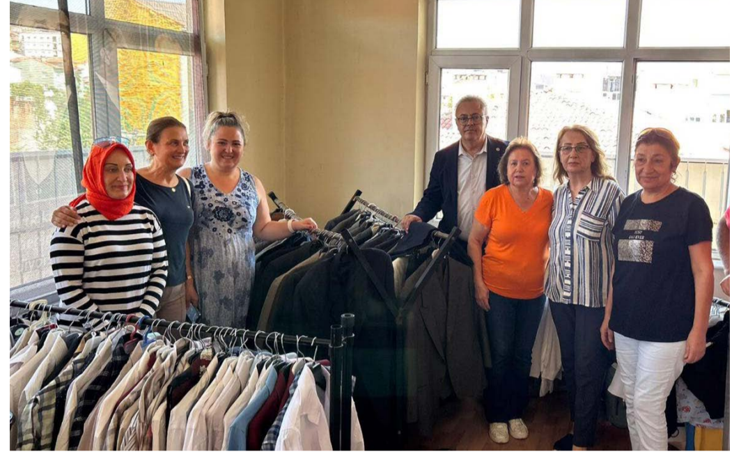
sahipleri için kıyafet ulaştırmak için kolları sıvadı.