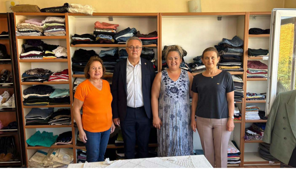
Cumhuriyet Halk Partisi Uşak örgütü oluşturduğu halk evinde ihtiyaç