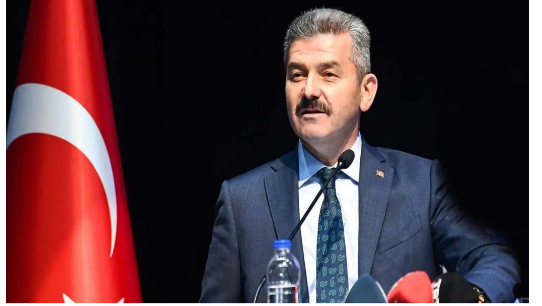
yürekten kutluyorum" dedi.