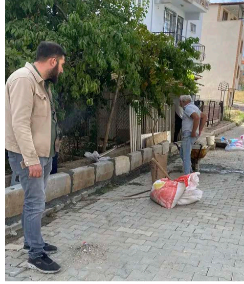
hem maddi hem de manevi olarak zorlandığını belirterek, bir an önce aracılığımızla

Kemalöz Mahallesi sakinleri, belediyenin altyapı sorununu çözmesini ve kalıcı önlemler almasını talep ederken, her yağmur yağdığı anda aynı mağduriyetle karşılaşan mahalle halkı, bu durumun kendilerini