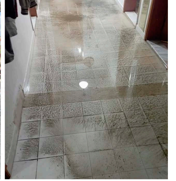
belediye yetkililerinden çözüm üretme çağrısında bulundular. / Arif Karakuvat