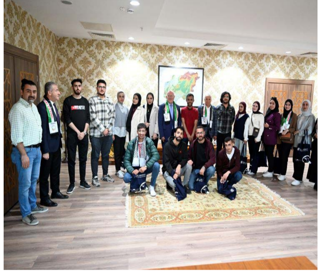
İlişkiler Genel Koordinatörlüğüne, tüm Uşak Üniversitesi ailesine ve Uşak'taki