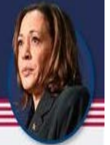
KAMALA HARRIS ABD Başkan Yardımcısı

Trump, önde görüldüğü salıncak eyaletlerin tamamını kazanırsa gerekli 270 delegenin üzerine çıkıp 312 delegeye ulaşabiliyor