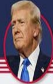
DONALD TRUMP Eski ABD Başkanı

Cumhuriyetçi aday Donald Trump, seçimlerin kaderini belirleyici 7 salıncak eyaletin tamamında Demokrat rakibi Kamala Harris'den 0,9 puan farkla yarışta önde götürüyor